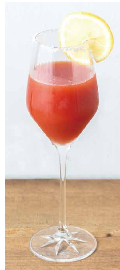
ブラッティメアリー 650 [アルコール] Bloody Mary トマトジュースとウォッカと粗塩。 夏の大人ドリンク