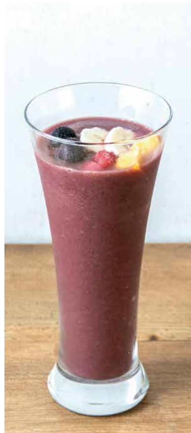
アサイー バナナスムージー 700 Acai Banana Smoothie スーパーフードアサイーと バナナの栄養がたっぷりスムージー