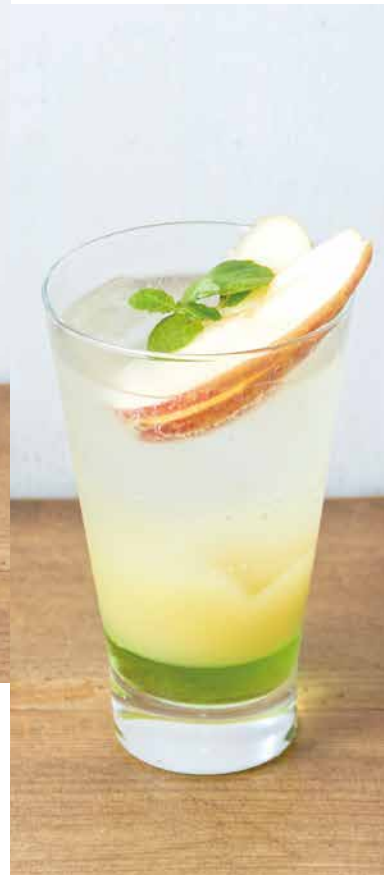
フレッシュアップル フィジードリンク 700 Fresh Apple Fizzy 2種類のりんごを使った 見た目も爽やかなサイダー