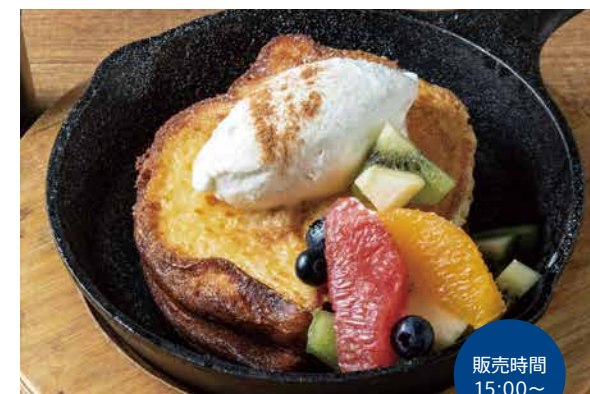
ブリオッシュフレンチトースト 950

マスカルポーネの濃厚なクリームと、スロージェットコーヒーの エスプレッソを加えたオリジナルティラミス