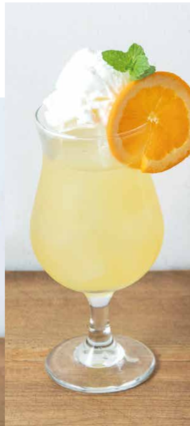
ココパインヨーグルト 700 Coconut & Pineapple with Yogurt 南国をイメージしココナッツ/パインジュースに ヨーグルトアイスをフロートにしました